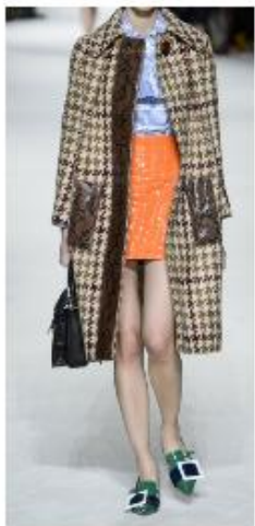
②クラシカルガーリースタイル