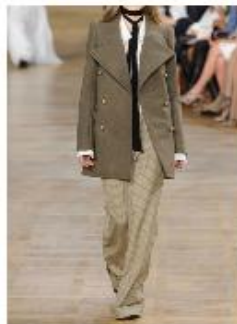
①ジェントルウーマンスタイル