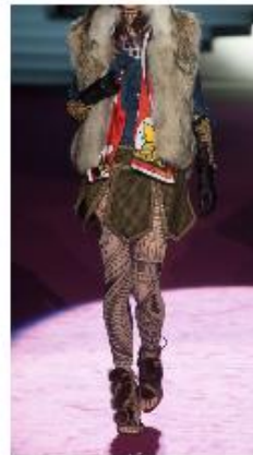
③エスニックミックススタイル